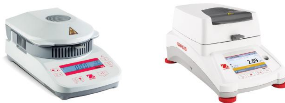
Рисунок 1 – Общий вид анализаторов

Общий вид анализаторов представлен на рисунке 1.