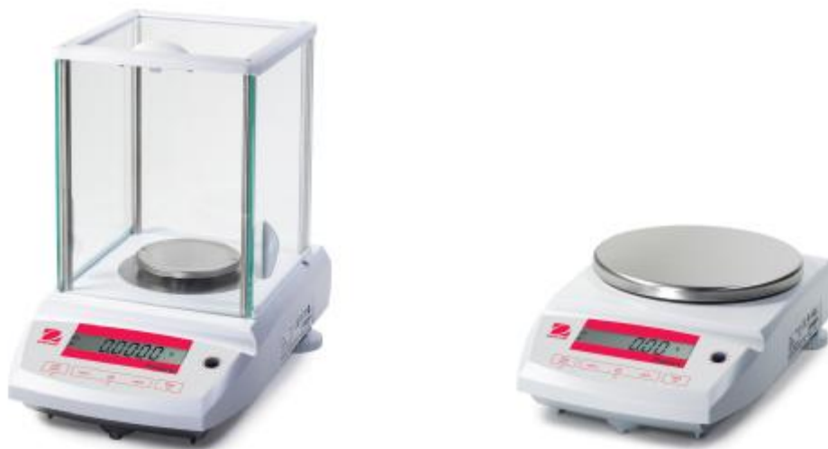
Рис. 1 Общий вид весов Pioneer

Принцип действия весов основан на компенсации массы взвешиваемого груза электромагнитной силой, создаваемой системой автоматического уравнивания. Электрический сигнал, изменяющийся пропорционально массе взвешиваемого груза, преобразуется в цифровой сигнал. Результаты взвешивания выводятся на дисплей.